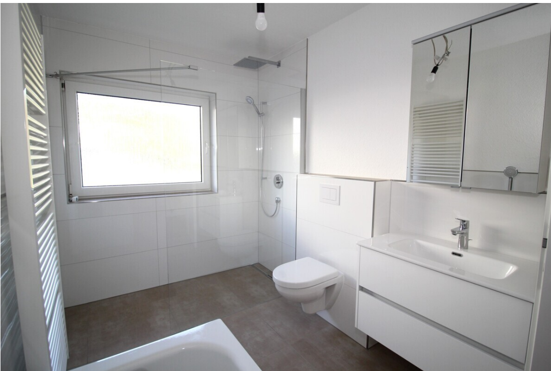
TGL Bad mit Dusche ...