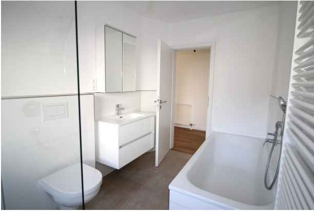
... u. Badewanne