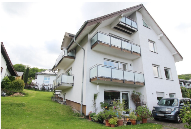
Hausansicht, Wohnung EG mit 2 Balkonen