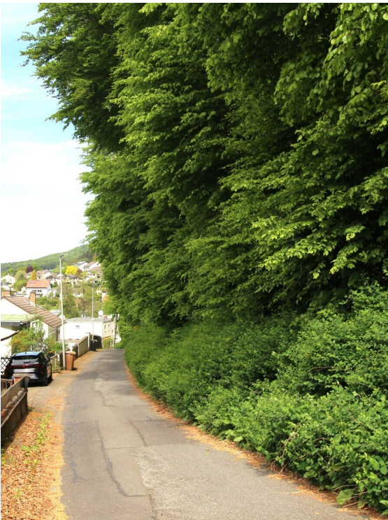
Straße zum Haus