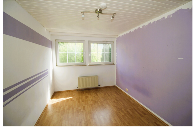
Zimmer 3 DG