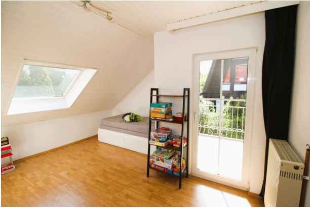
Zimmer 2 DG