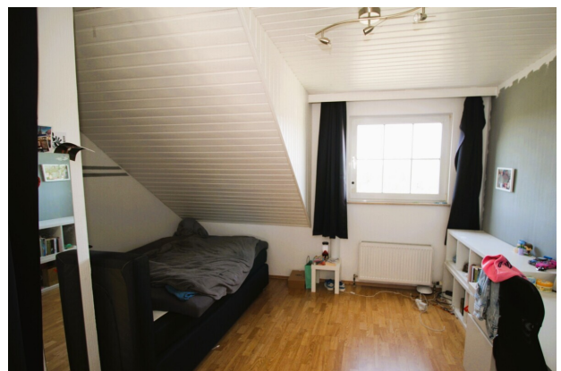
Zimmer 1 DG