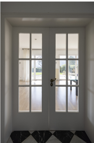
Tür zum Wohnbereich