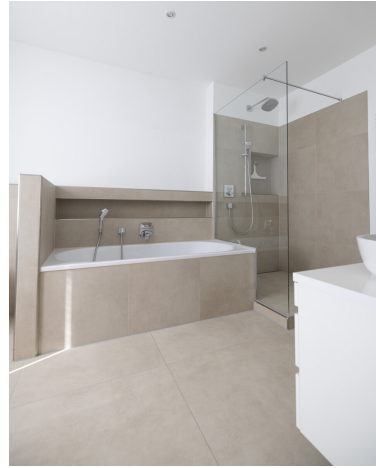
mit Badewanne und Dusche