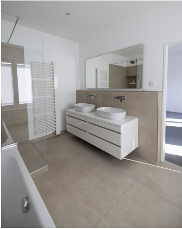
Bad en suite