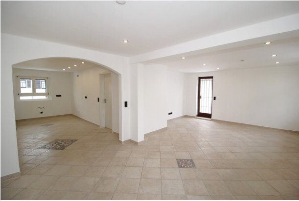
Offene Küche u. Wohnbereich