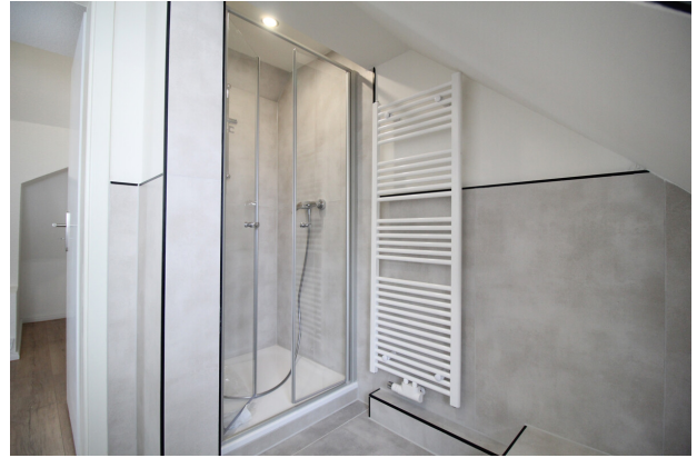
... mit Dusche