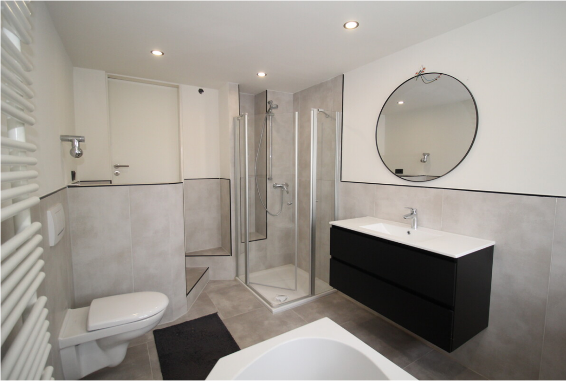
... u. Duschbad