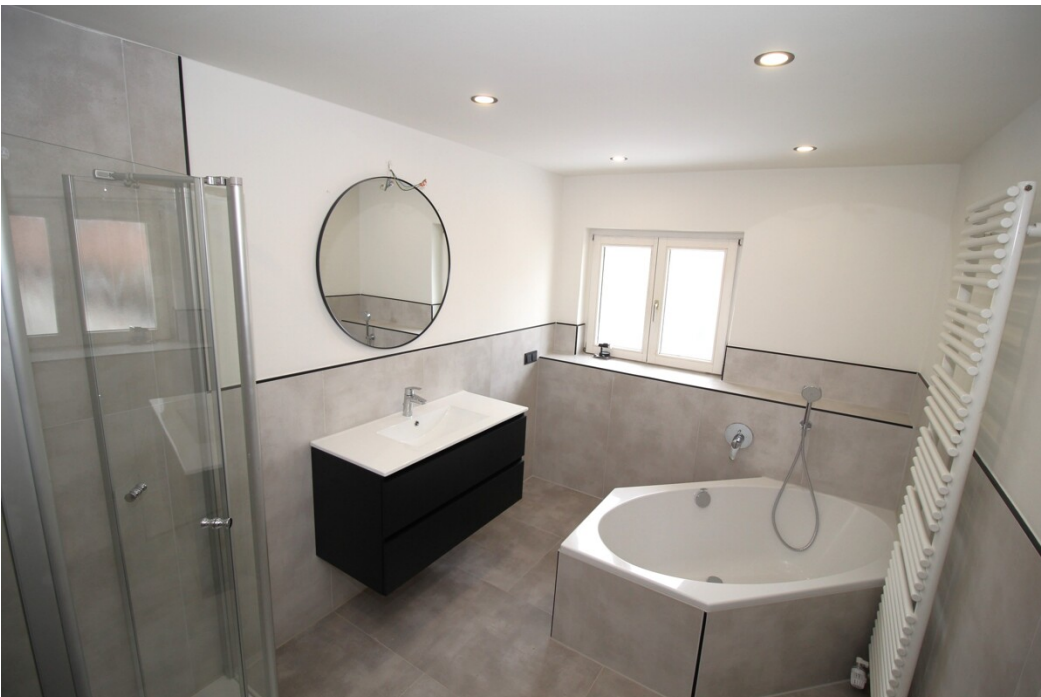
TGL Wannens- ...