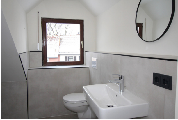
TGL Bad ...