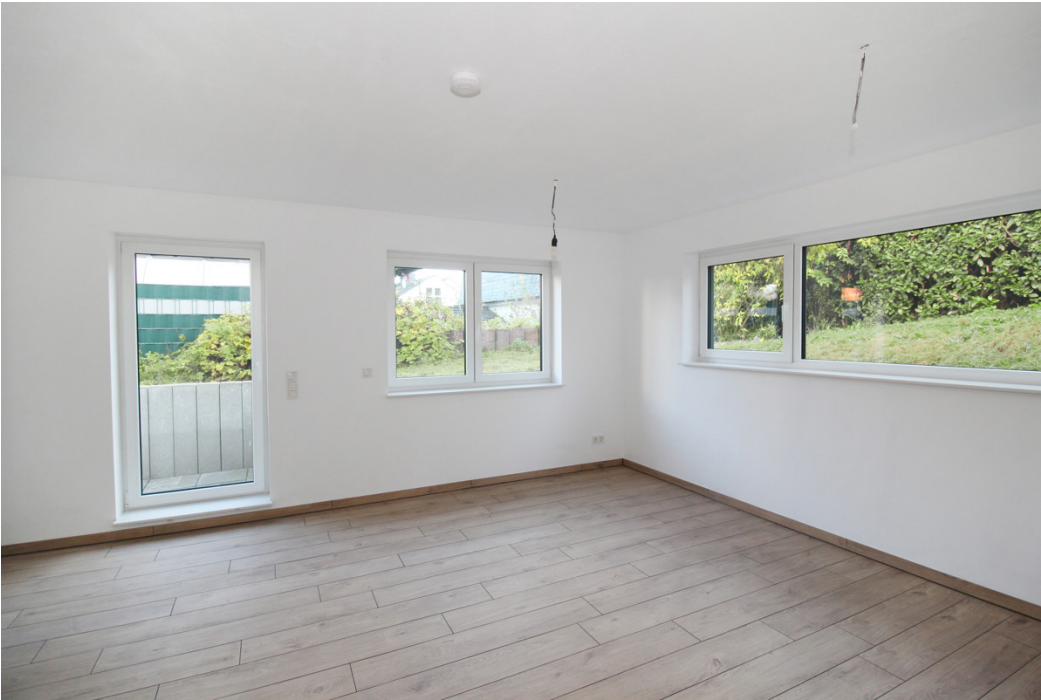
Wohn u. Essbereich