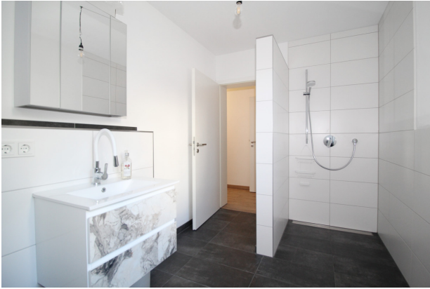
... mit großer Dusche